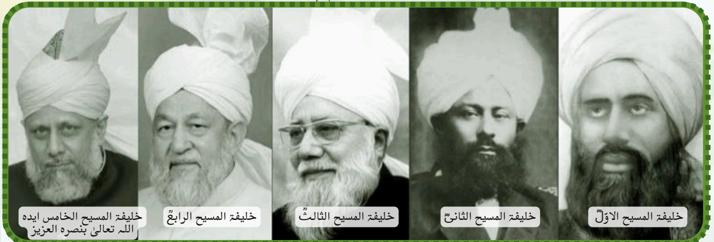
خلیفۃ المسیح الخامس ایدہ اللہ تعالیٰ بنصرہ العزیز

اس نقطہ نظر سے خلافت کی اہمیت روز روشن کی طرح عیاں ہو جاتی ہے کہ ترقی ایمان اور قبولیت اعمال کی اب نظام خلافت کے سوا کوئی صورت نہیں ہے۔ جسے متاع ایمان اور عاقبت کی فکر ہو اسے لازم ہے کہ وہ خدا تعالیٰ کی قائم کردہ خلافت کے نظام کے ساتھ ہوجائے جو آج جماعت احمدیہ کے سوا دنیا میں کسی اور کے پاس نہیں ہے۔